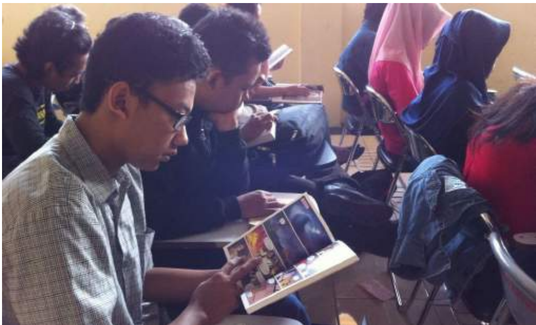
SSR di kelas Poetry Appreciation

Di pertemuan kedua, ketika saya sudah siap dengan materi kuliah dan buku bacaan di tangan, saya harap-harap cemas. Apakah mahasiswa ingat dengan tugas membawa buku. Ternyata semuanya sudah siap dengan buku di tangan masing-masing. Wah, awal yang baik. Tanpa banyak penjelasan, saya langsung set waktu. Okay, time for SSR!