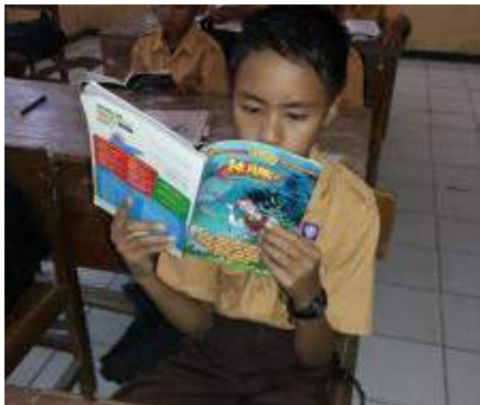
SSR di kelas bu Icha

mengantisipasi bila ada siswa yang tidak membawa buku. Strategi bu Icha dan bu Uut menunjukkan bahwa syarat utama agar SSR berjalan baik adalah dengan menyediakan akses terhadap buku. Langkah ini kemudian berkembang menjadi pengembangan sudut baca di kelas.